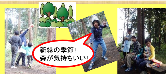
新緑の季節! 森が気持ちいい!