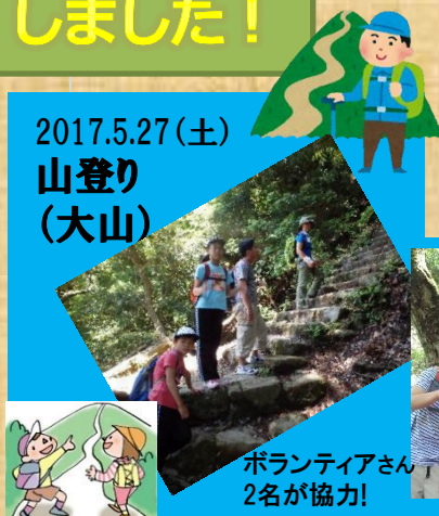
ボランティアさん2名が協力!