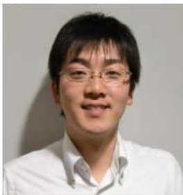
とちぎユースサポーターズ ネットワーク共同代表

2011年4月23日(土)、時折強く雨の降る中、とちぎユースワークカレッジ教室にて第4期入学式が行われました。今回の入学式は、3月に発生した地震の影響で計画停電などが予想されたため、とちぎユースワークカレッジ教室で学生及び保護者様、スタッフのみでの挙行となりました。入学式では、学生は緊張した面持ちでしたが、最後に一人ひとりが参列者に向い誓いを発しました。ここからカレッジでの半年間がスタートします。今期立てた目標が達成できるようにスタッフも協力させていただきます。