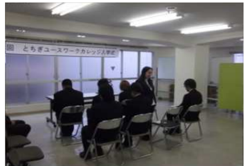
学生一人ひとりが入学にあたっての思いを語りました。