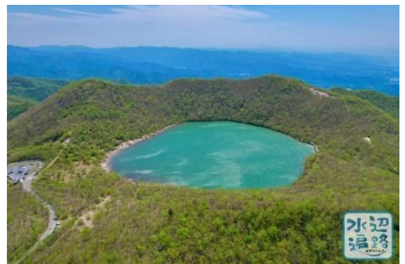
小沼駐車場と小沼・長七郎山