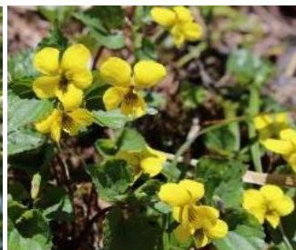
天神平:ナエバキスミレ、マチガ沢:サワグルミ保護林