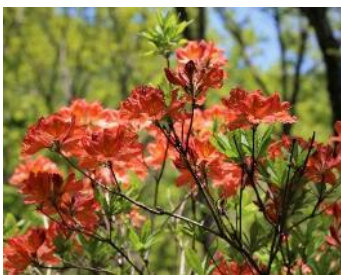
覚満淵:レンゲツツジ、