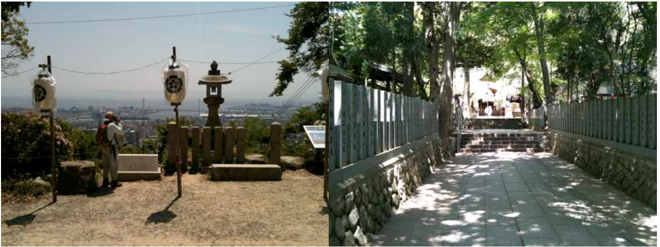
(↑保久良神社からの眺めと、保久良神社の神殿)