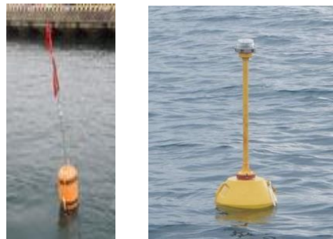
図4 ゼニライト付き旗ブイ(写真左)及び ゼニライトブイ(写真右)参考