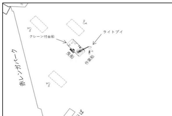
図3 アンカー設置作業

※アンカーにはそれぞれアンカーブイ(図4 ゼニライトブイ又はゼニライト付き旗ブイ)を設置いたします