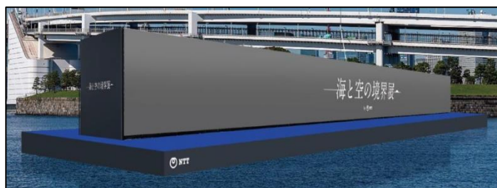
図6 LED 台船設置イメージ