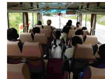
大島を探索・ウォーキング