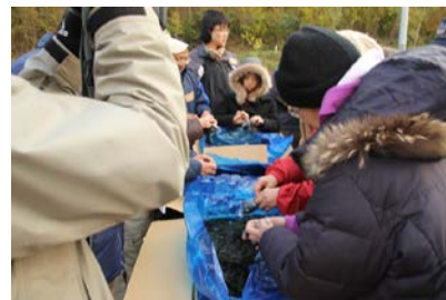
大島産のワカメは自宅で♪

今、気仙沼・大島の逸品が大集合 交流会の楽しみは、気仙沼大島の食にあり 美味しい食を前に会話も弾む♪