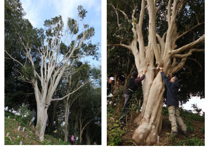
肌がきれいな凜とした大椿です

「磯崎の大椿」愛称を募集します! その前に 25日に高尾の森の皆さんに大椿を計測して頂きました。結果は・・・ブログで・・・