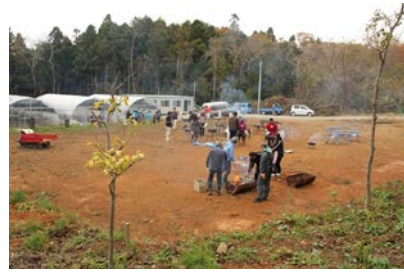
皆で一汗♪ 椿園の整備も..