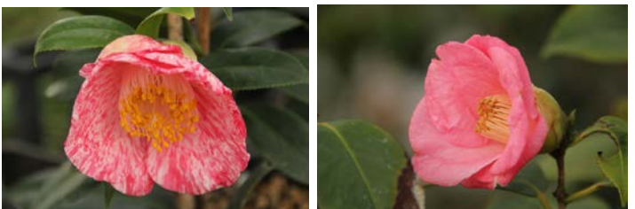
錦秋 (きんしゅう) 初音 (はつね)

交流秋の会場にありましたハウス 皆様、ご覧になりました? 全国の椿愛好者の皆さんから 贈っていただいた園芸種の椿、咲き始めました♪