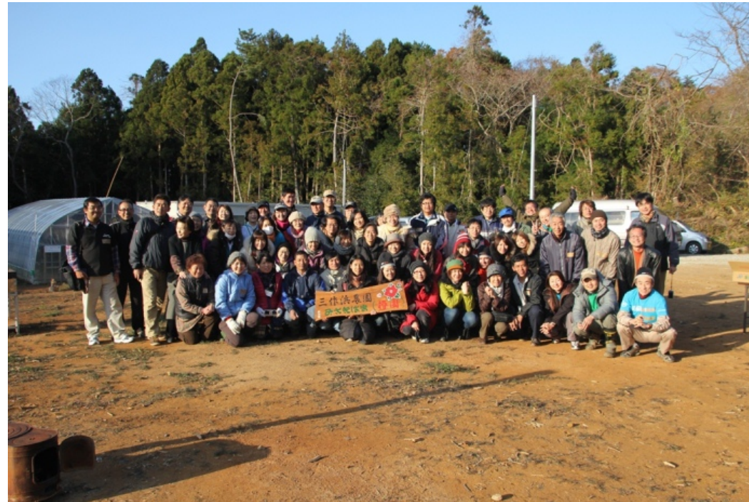
これからも、応援よろしくお願いいたします