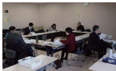
第1回奨学生選考委員会