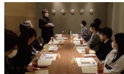
奨学生との親睦会