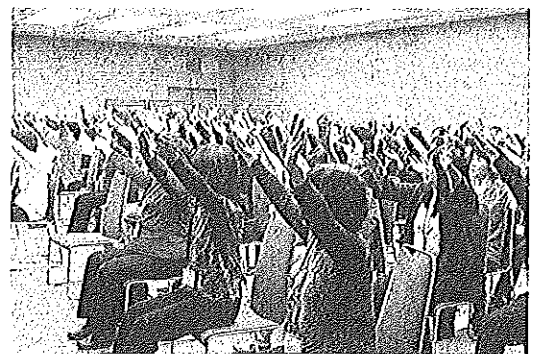
第64回全国レクリエーション大会 IN 静岡風景