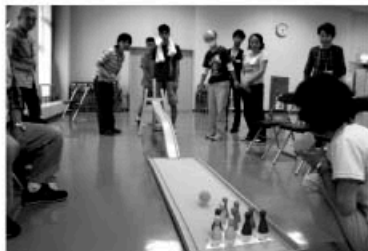
障がい者・高齢者 ゲーム交流会