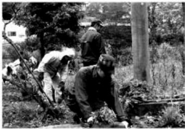
東日本大震災ボランティアバス

まず、東日本大震災では被災地への職員派遣、街頭募金を行い、宮城県南三陸町へはボランティアバス派遣をし、和歌山県日高川町へは職員、災害救援ボランティアバスの派遣を致しました。