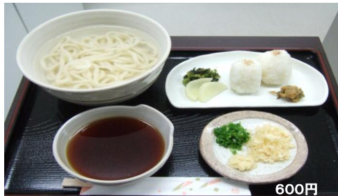
釜揚げうどんセット