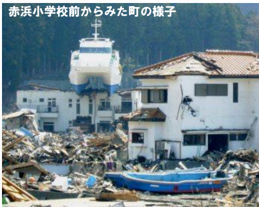
赤浜小学校前からみた町の様子

●お二人に話を伺うと、自衛隊の風呂にいらしているので、大丈夫と。入浴以外のニーズを伺っても特にないとのことでした。