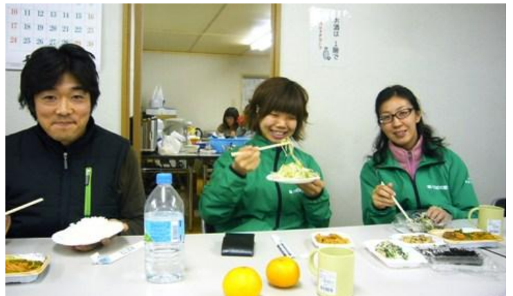
15日の夕食風景（遠野市ボランティアセンター）