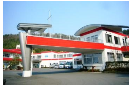
特別養護老人ホーム三陸園（吉里吉里）