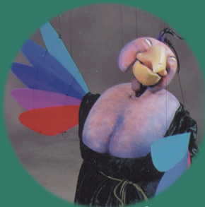
マリアカラスのダンス