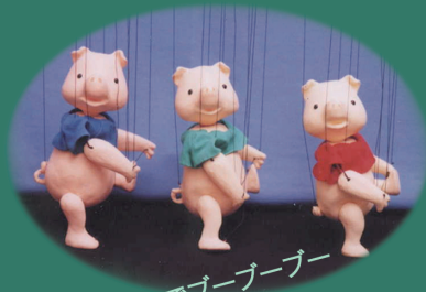
よそみをしないでプープープー