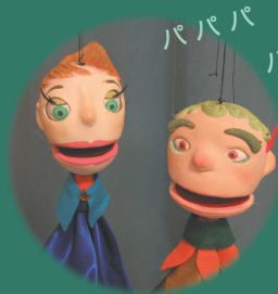
パパパ パイパイはなみずくん