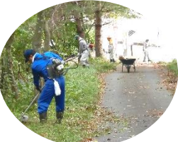
大変きれいになりました。ご協力いただいた皆さま、お疲れさまでした。