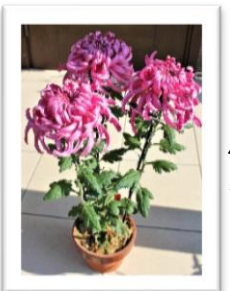
この時が何よりの喜び！