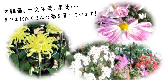
菊は人に観られてこそ喜びといわれています。