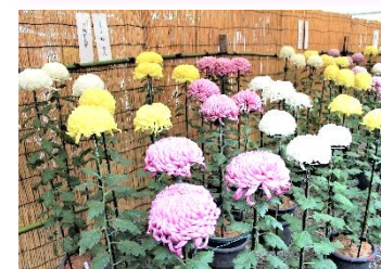
昨年は教育長賞を受賞！

「今年は10/21～11/17まで開催」 大菊づくりを通じた仲間との交流も、楽しみの一つです。「菊友会」のみみなでお酒を飲んだり、カラオケしたりすることも♪