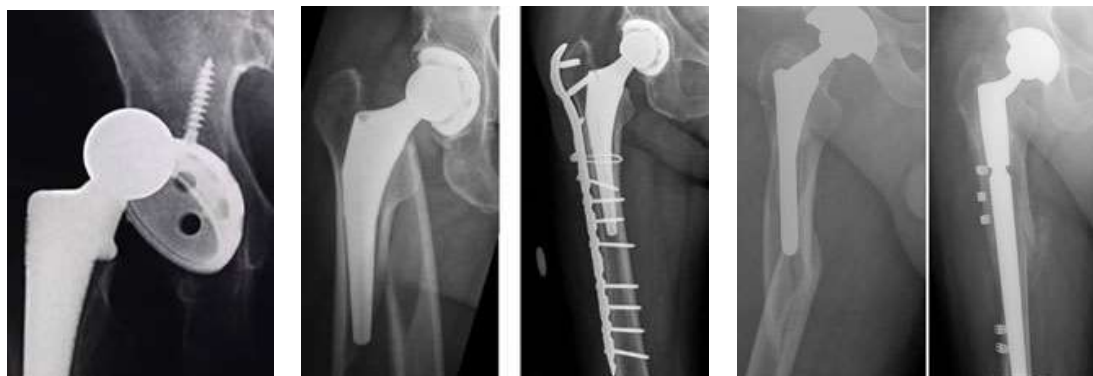
人工股関節の脱臼 人工股関節周辺骨折と、骨折手術

何年も安定していた方でも、思わぬアクシデントで脱臼することがあります。一番多いのは転倒です。転んだ拍子に脱臼してしまうのです。転んだ場合には脱臼でなく、人工関節周辺骨折を起こすこともあります。この場合は特殊な固定金具を使った手術が必要になることが多いです。