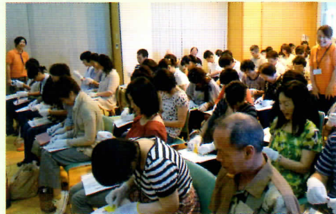
昨年もたくさんの方に参加して頂きました。