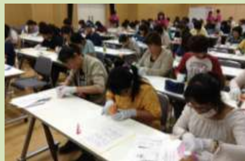
毎年、たくさんの方に参加して頂いています。