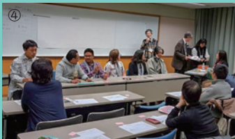
①オープニング、②シンポジウム、③展示ブース、④ワークショップ