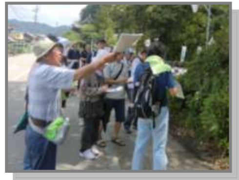
前回のまち歩き(7/2)の様子 親子連れの参加者がたくさん来られました