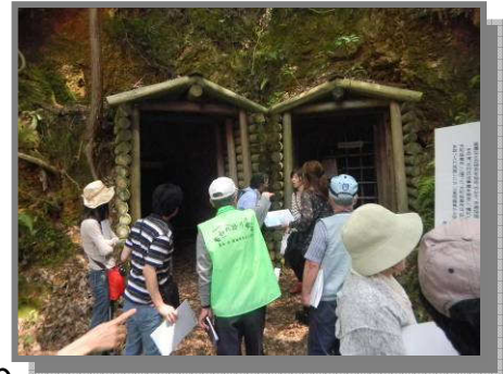
前回のまち歩きの様子 水銀坑跡はとっても涼しい!

1万本以上のアジサイが咲き乱れる丹生。そこに詰められた地域の人たちの想いに触れてみよう。夏の田んぼの風景にも注目!まめやさんでは豆腐のつくり方を教わるよ。夜は冷ややっこで決まり!?