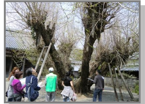
前回のまち歩きの様子(本楽寺にて)

今回は森とお茶がメイン。森に隠れている歴史や、シャープの森の取り組み、お茶にまつわるお話など、新しい発見がたくさん見つけられそう!