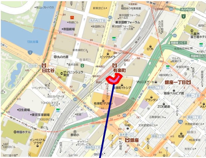
有楽町駅前広場(イトシア前)