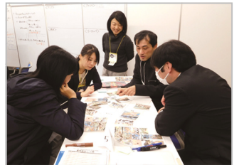
▲ ワークショップの様子