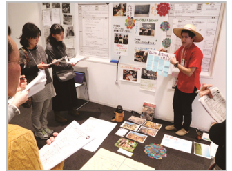
▲ ポスターセッションの様子