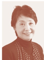
ことばの杜代表 元NHKアナウンス室長 山根 基世氏

1948年、山口県生まれ。1971年、早稲田大学文学部卒。同年、NHK入局。主婦や働く女性を対象とした番組、美術番組、旅番組、ニュース、「ラジオ深夜便」、NHKスペシャル「人体」「映像の世紀」等、大型シリーズのナレーション多数を担当。2005年、女性として初のアナウンス室長。2007年、NHK退職後、「子どもたちのことば」を育てることを目的に、LLP「ことばの杜」を設立。朗読会、読み聞かせ講座、教育教材の開発、指導者への支援など、放送経験を生かした様々な活動を行っている。2000年・放送文化基金賞、2009年・徳川夢声市民賞受賞。東京大学客員准教授、女子美術大学講師等歴任。「ことばで『私』を育てる」(講談社文庫)他、著書多数。