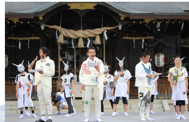
ふくしま未来神楽 (2015年8月23日: 福島市)

突然襲った目に見えない恐怖 汚されてしまった空、山、川、海 そして引き裂かれた人々の営み 時とともに深まる悲しみと絶望と怒り 福島を風化させてはならない