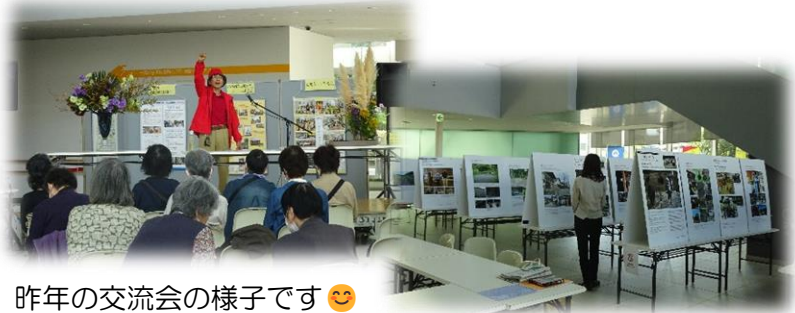
昨年の交流会の様子です 😊