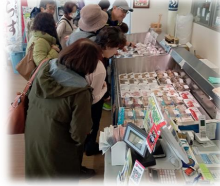
浪江町「柴栄水産」でお買い物

【にんじんカフェお食事会】★10/11(金)・11/8(金)13:00～14:30 会費:食事代実費1,000円 会場:キャラバンサライ飯店舗 住所:習志野市本津田沼5-5-17 電話:047-452-5123