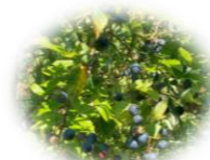
今年もたくさんの実がなっていました。