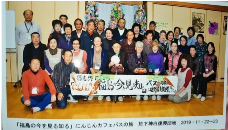
「福島を今を見る知る」にんじんカフェバスの旅 於下神白復興団地 2019・11・22～23

★11月22(金)・23(土)に開催*浪江町の十日市開催は11月23・24日の2日間です。 楽しみバス旅に参加して懐かしい友人、知人とふるさと浪江で再会してみませんか！ ◎参加費、行程等問い合わせをお待ちしています。