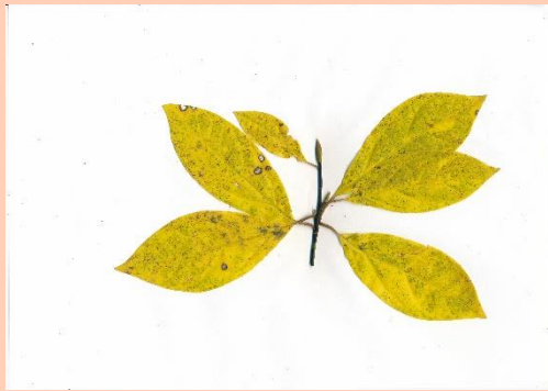
オオバクロモジ(大葉黒文字)