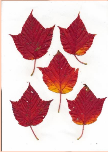
ウリハダカエデ(瓜膚楓)