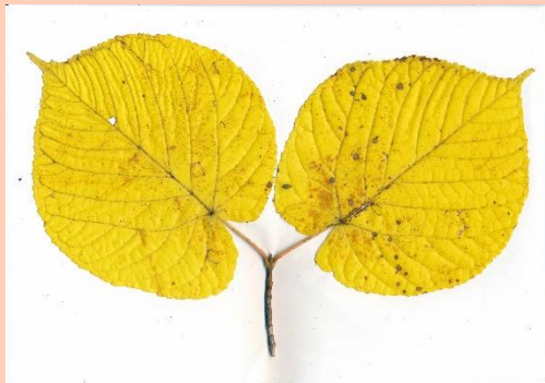
ヒトツバカエデ(一葉楓)