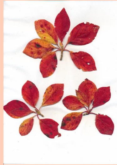
サラサドウダン(更紗灯台)