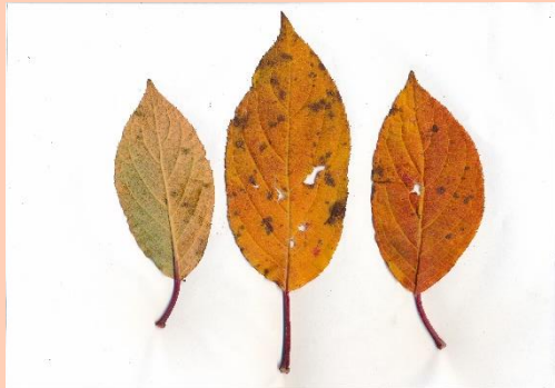
ノリウツギ(糊空木)