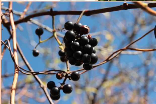
ヤマブドウ(山葡萄)