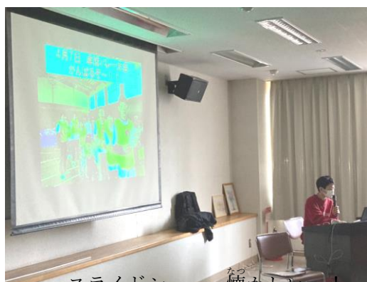
スライドショー、懐かしい～！