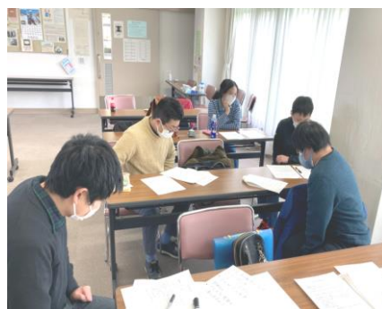
大会決議 (案) 話し合い

仙台市宮城野障害者福祉センターで10人が参加しました。令和4年度は、東北ブロック大会が宮城県で開催されるため、事前の内容確認や準備のための話し合いをおこないました。そのあとは、2019年度から2021年度までのフレンズ会