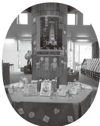
美浜町図書館 (認知症関連図書コーナー設置)