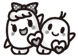
共同募金キャラクター 愛ちゃんと希望くん

夏休みを利用して、町内小中学校の児童生徒の皆さんに「赤い羽根共同募金」をテーマにした作品を募集したところ、書道318点、ポスター133点のご応募をいただきました。この作品コンクールは、児童生徒の社会福祉への理解を深め、「たすけあい」の心を育むために実施しております。