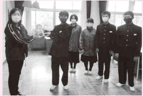
河和中学校生徒会の皆さん

皆様からお寄せいただいた募金は、社会福祉協議会が行う住民を主体とした地域福祉活動や、各種団体・ボランティアグループの助成など「美浜の福祉」に活用させていただきます。募金に協力いただきました町民の皆様のご理解とご協力に対しまして、この場をお借りして厚くお礼申し上げます。ありがとうございました。