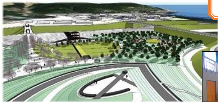
震災復興記念公園