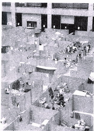
熊本地震の避難所になった体育館＝2016年7月、熊本市南区