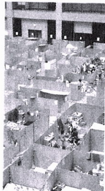
熊本地震の避難所になった体育館＝2016年7月、熊本市南区

災害人の心大きな影を及ぼす。2016年の熊本地震で避難した住民が熊本市で暮らす。発生から4年以上たっても抑うつや不眠を訴える人が少なくないことが分かった。孤独感が影響を及ぼすに加え、新型コロナウイルス流行による生活の変化が追い打ちをかけている。熊本市の大河内彩子教授(地域保健学)は「被災者へのケアが必要だ」と話す。 「きめ細かいケア必要」 熊本市は20年11月、熊本市の被災者へのケアが必要だ。熊本市は20年11月、熊本市の被災者へのケアが必要だ。熊本市は20年11月、熊本市の被災者へのケアが必要だ。