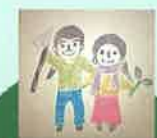
太陽と月の家 (栗石町)

八幡平市(旧西根町)にて、慣行栽培でほうれんそうを作っている農家です。ほうれんそうを始めとする青菜いろいろ、他季節のお野菜いろいろあります。