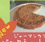
ジェーマンカフエ パックシュトカーベ (花巻市)

講師:クマガイクキコ 時間:13:00~14:00 人数:8名 参加費500円 持ち物:あれば彫刻刀 対象:小学校高学年~おとな