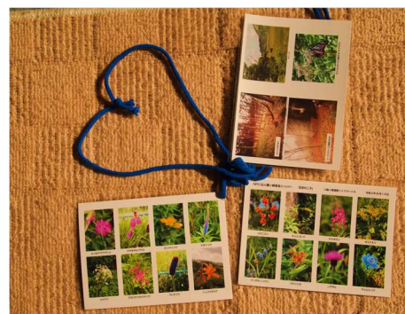
簡易ガイド写真集「あれこれ」 ツアーの参加のお客様に謹呈

【申し込み先】 e-mail kirigamine.kikin@gmail.com TEL 090-9668-3380