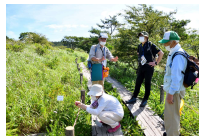
エコツアーの様子 今年度はマスクなしでOK