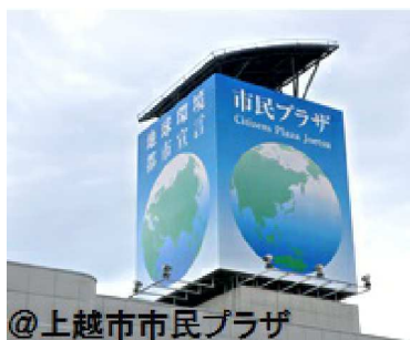
@上越市市民プラザ 160200