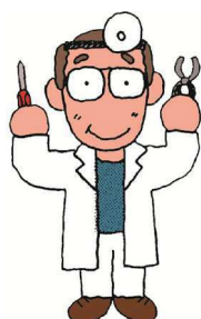
日本おもちゃ病院協会 おもちゃドクターイラスト