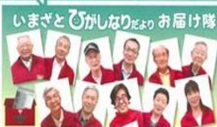
今里まちづくり活動協議会