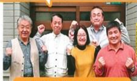
中道地域活動協議会