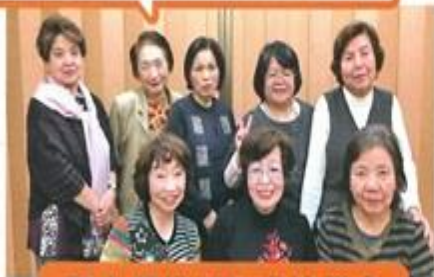
東小橋地域活動協議会