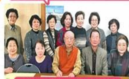
神路地域活動協議会