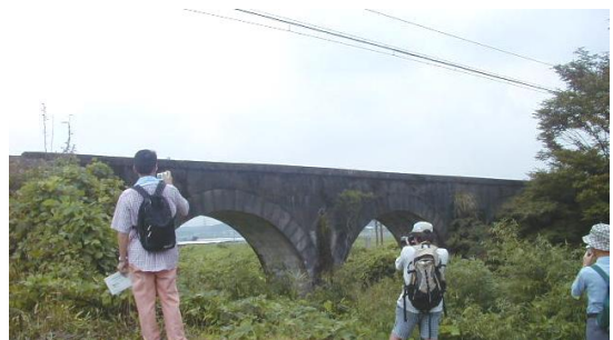
めがね橋（明智川穹窿橋）

雲納寺の眼洗い地蔵を見たあとは、彼岸花が咲き乱れる中を、北からめがね橋へ進んだ。この橋の正確な名称は明智川穹窿橋といい、コンクリートブロック製のアーチ橋である。めがね橋から東に200メートルほど離れたところに、ねじり橋がある。正確には六把野井水拱橋という。下を流れる六把野井水が、直角ではなく40度の角度で交差しているため、絶妙な勾配を駆使したアーチ橋が架けられた。このアーチ橋は存在が確認されている現在唯一のコンクリートブロック製ねじりまんぼ(型枠整形が不揃い)で、『日本の近代土木遺産—現存する重要な土木構造物2000選』(土木学会出版)によれば、Aランクの