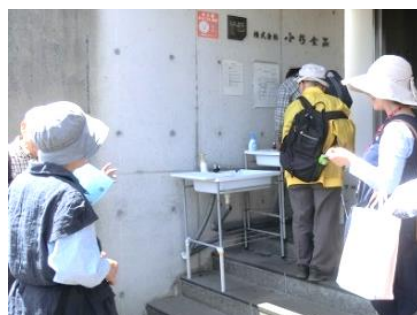
入口で手洗いとうがいをする