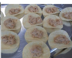
納豆のマヨネーズ和え