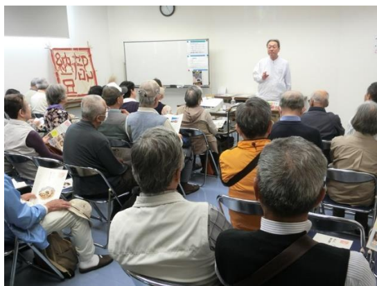
レクチャーの様子

レクチャーの後は納豆を試食させて頂き、保冷手提げ袋のお買い得セットも用意されていた。玄関の外にも納豆の自販機があり、単品で買うことが出来る。小杉食品の至れり尽くせりの対応に感謝しつつ、玄関先の「納豆石」のモニュメントに見送られながら、小杉食品を後にした。