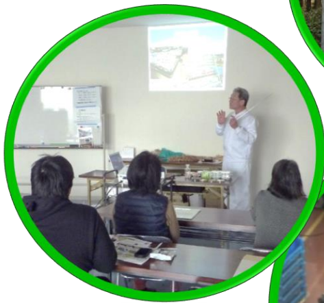
小杉食品 レクチャー 工場見学