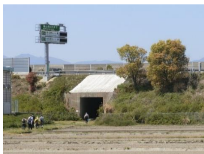
東名阪自動車道の下を通る

小杉食品は表からではなく駐車場から入るコースとしたので、小杉食品の社員さんが所々に立って笑顔で出迎えてくれた。