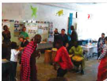
会場はアフリカー色！

昨年11月12日、13日に防府市のルルス防府にて、地域の団体と協力して、アフリカ&パーカッションフェスティバルを開催しました。アフリカの文化や今をたくさんの方に感じてもらいたいと、衣・食・音楽などを体験できるコーナーや地域の団体の活動紹介、コンサート、講演会と盛りだくさんの内容で行いました。山口ケニアを知る会の現地スタッフのお二人や県内在住のアフリカ各国出身の方も来場され、会場を盛り上げてくださいました！ご協力・ご参加いただいた皆様ありがとうございました！