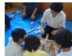
いすづくり体験 たいけん