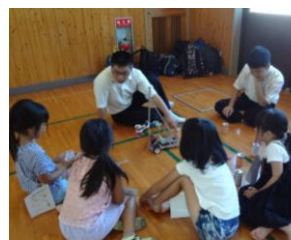
たのしみ工作 こうさく