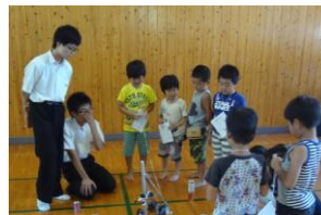
ロボットとあそぼう

昨年 さくねん から始めた宮崎工業高校 みやざきこうぎょうこうこう の学生さん がくせい との行事 ぎやうじ でした。18人 にん の学生さんたちがロボットや遊ぶ あそ る工作 こうさく の材料 ざいりょう を持って来てくれました。ロボットを操作 そうさ したり、一緒 いっしょ にあそんだりとても楽し たの そうでした。