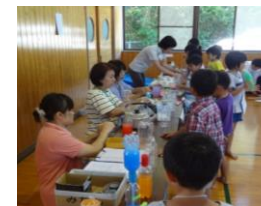
スライム時計 どけい