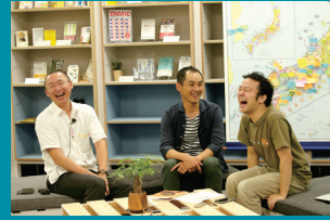
収録は終始なごやかな雰囲気です。

これからの働き方へのヒントがたくさんつまっています。中には、インフラがそろい、多様な働き方への理解も進んでいるような都市でできなかった働き方が、地方に行ったら実現できたといったお話もあります。