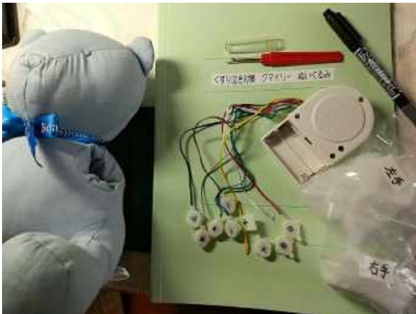
止めていた糸を切る前、印を忘れずに3個が断線、他にもいつ切れるか心配だ