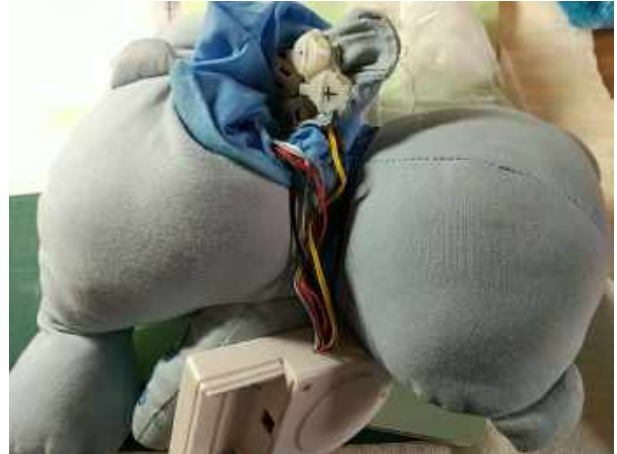
お裁縫が苦手な Dr の奥の手「ふくろ返し」ぬいぐるみの中に手を押し込み背中から出す