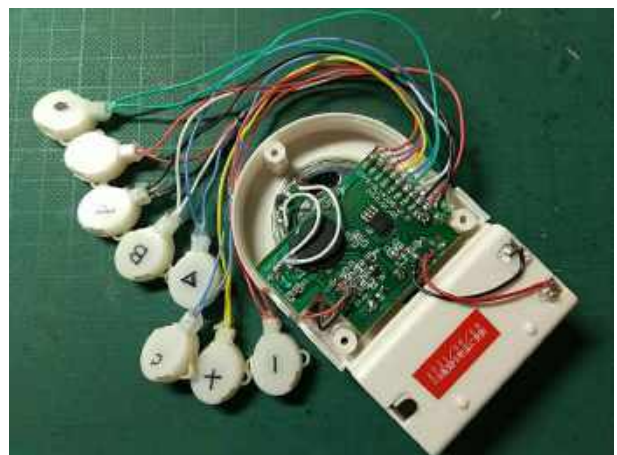
両手8個のスイッチ配線、更新完了左右で配線長を違えるべきだったが