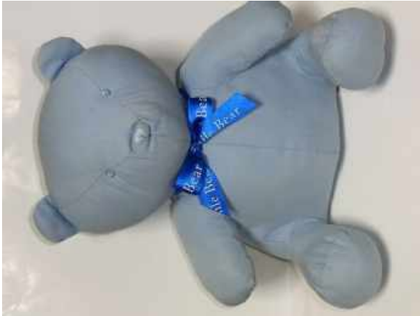
2021年5月、のう病院にて受付、クマイリー「いくつか効かないスイッチがある」とのこと