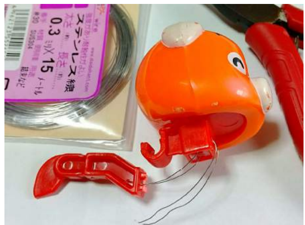
6)折れた支柱の復元は、困難を極めた 先に接着してしまうと台座に戻せず失敗