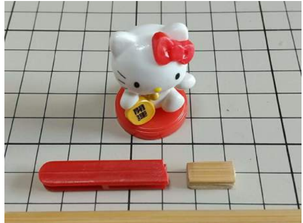
8)中心のウサギに代え、「開運」キティちゃん 折れた支柱は、竹の割りばしで長さを調整