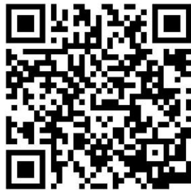
スマホで、この二次元コードを読み取り、 「電子カルテ」の画像を閲覧できます。