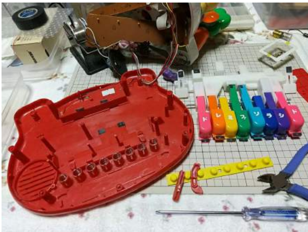
3)慎重に分解を進め、ケース底板に至る ここで、赤い支柱の欠片2個を発見