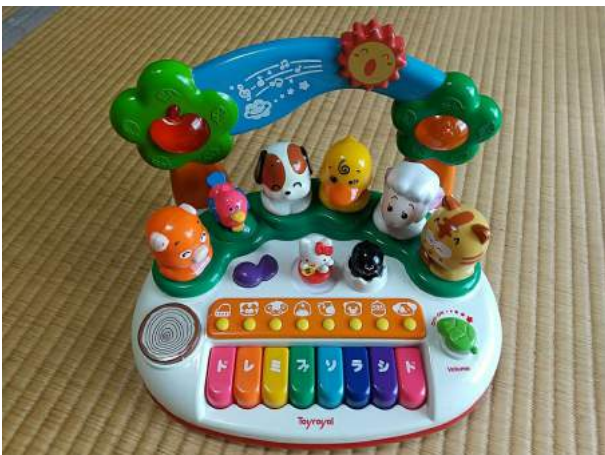
11)思い出のおもちゃにふたたび命を！！ 「ゆりかご」に入院して、本当に良かった。