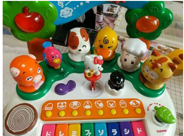
10)支柱の先端で水平に自立することを確認 エポキシ接着剤が硬化するまで、しばし養生