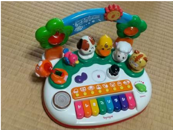
1)光るどうぶつドレミ隊、中心のウサギ紛失 こブタの支柱も破損、全く音が出ない