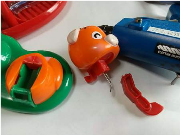
7)首と支柱にピンを立てて補強する手順 台座に頭部を載せてから、下から接着