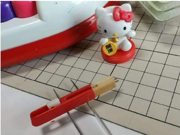
9)折れた支柱とはステンレス線で締めて接着 先端にピン2本を立て、キティちゃんと接着