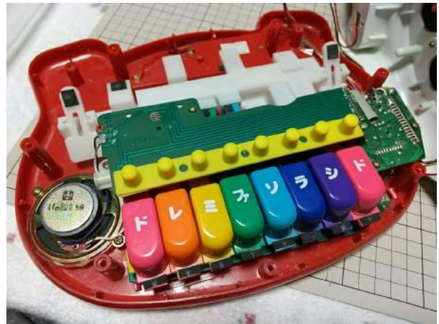
2)外見はひどく破損しているが、内部はキレイ 基板の下にピアノキー、その下にも基板あり