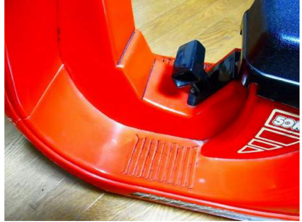
②動力源は、単1電池×8本=12V クラッチ付き (前進・中立空転・バック)