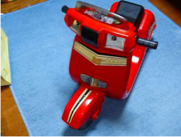
①赤い乗用バイク New リード50 ギヤが効かない (35年前のもの)