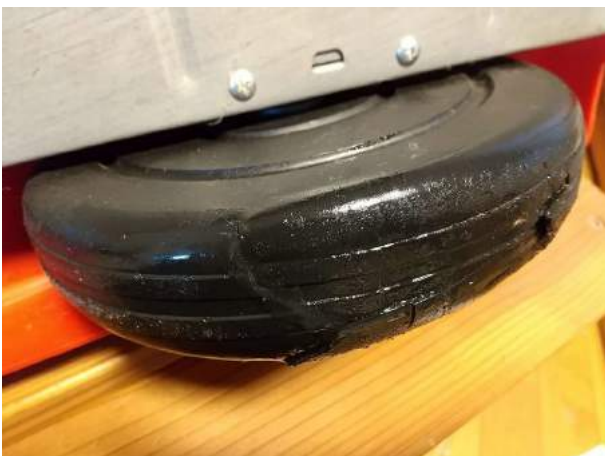
⑤タイヤのヒビ割れを接着剤で仮補修 今後は屋内での「お宝」展示品に再生