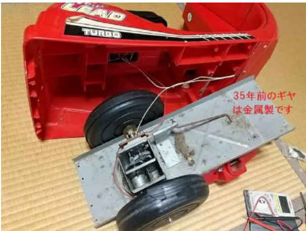
③35年前のギヤはガッチリした金属製 後輪の右側タイヤにヒビ割れが見える