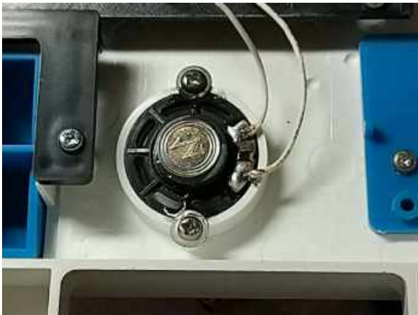
スピーカを新品に交換後、動作確認済 小ネジ2本で固定後、接着剤も併用