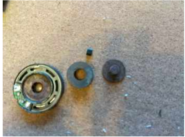
スピーカの固定が悪く、外れて転がっていた スピーカ自体も老朽で腐食し、破損