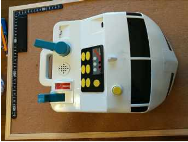
おはなしIPPAYのぞみ号 音が出ない ツクダオリジナルは「オセロ」で有名なメーカー