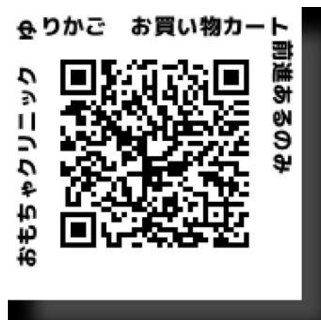
診療カルテは、スマホで見ることが出来る。 バーコードの、URLリンクをご覧ください。