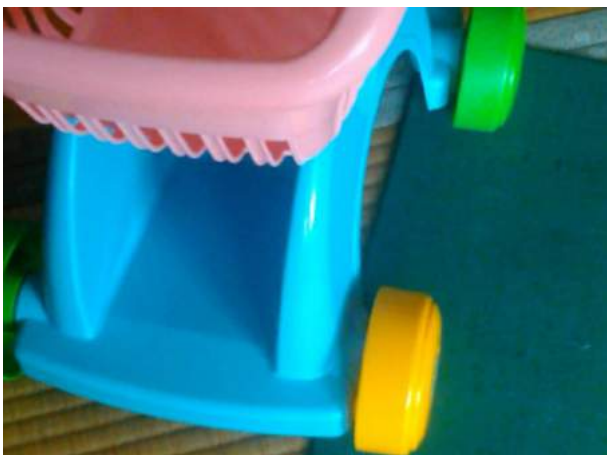
見た目には違和感なく、治療完了。 なるべく、まっすぐ前に押してください。