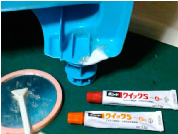
欠けた部分を厚さ2mmのプラ板で補修。 両側から、エポキシ接着剤で固める。