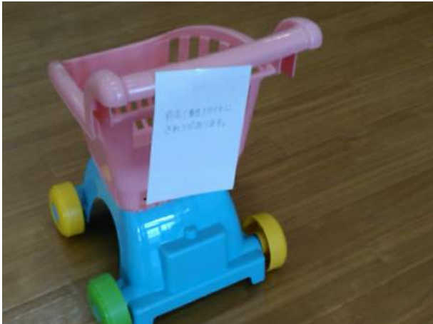
2019年7月21日、ひまわり病院で入院。 保育園のお買い物カート、前輪に亀裂。