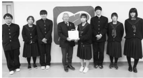
萩高等学校奈古分校