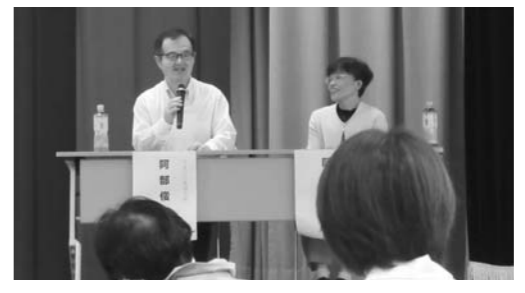
（夫婦二人三脚で楽しく講演）