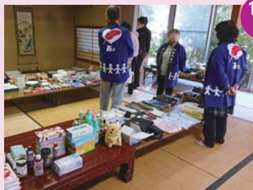
11/3 宇田郷地区(ふれあい祭り運営委員会)

ボランティアさんの協力と地域のみなさまの善意でたくさんの方の品物を寄付いただき、4年ぶりに福祉の市を開催することが出来ました。