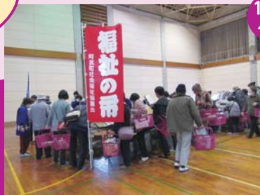
11/19 奈古地区(ふたば会)