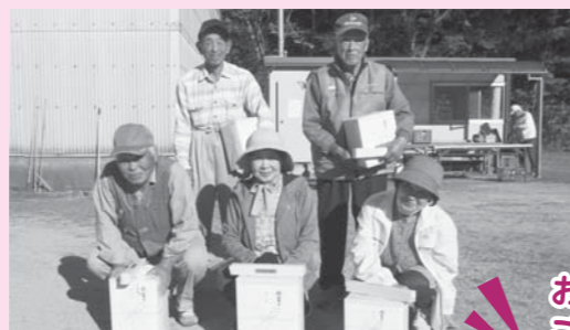
おめでとうございます

10月23日に福賀グラウンドゴルフ場で開催しました。秋晴れの中、23人の参加者が上位を目指して、白熱の勝負を繰り広げられました。