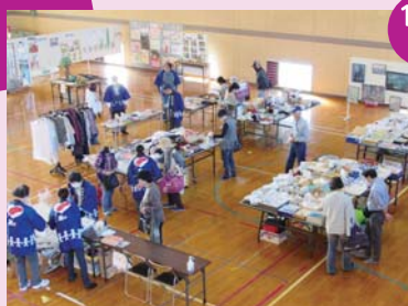
11/5 福賀地区(ほほえみ会)