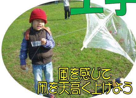
風を感じて 凧を天高く上げよう