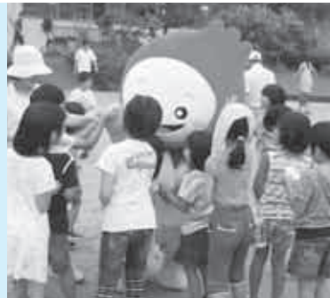
あいちゃんは体操上手だよ