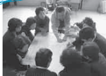
「支え合いマップ つくり」の様子

桜木区は豊岡市街地に位置する約170世帯の区です。昔からの顔なじみが多い地域ですが、ひとり暮らしや閉じこもりがちな方など、気になる高齢者世帯が増えたことから、7年前に「桜木ひまわりサロン」を立ち上げました。サロンを通じて交流を重ねることに支え合いの輪が広がり、今では桜木区の地域福祉活動の中心的存在となつていきます。また昨年からは、閉じこもりがちな男性高齢者を何とかしたいと「男性サロン」も立ち上げ、更に活動の幅を広げておられます。 今年の4月と7月にはサロンお世話役の皆さんで「支え合いマップづくり」を行い、区内の支え合いの現状を確認し、気になる方をサロン参加者や地域で見守り・支え合っていく方法等が話し合われました。