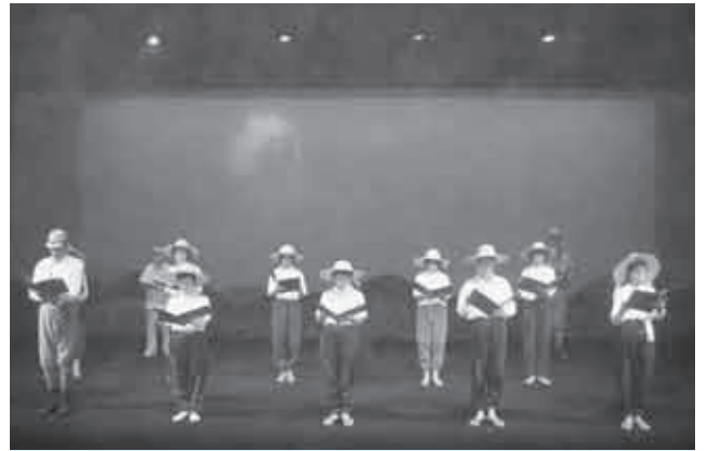
原爆の怖さ、人々の悲しみを映像と共に朗読