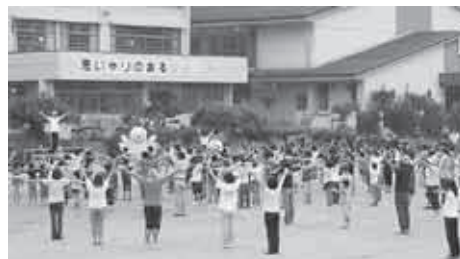
みんなで1、2、3、気持ちいいね！