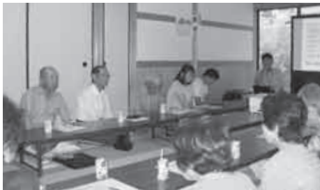
スライドでも説明