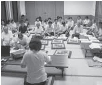
みなさんのご意見お聞かせください