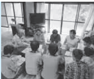
「いきいきサロン高龍寺」宮城県での救援活動のお話もつかがいました