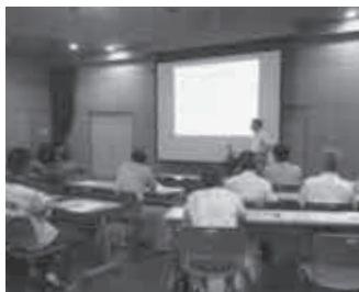
区長会での研修会 但東でも活断層が見つかっているそうです