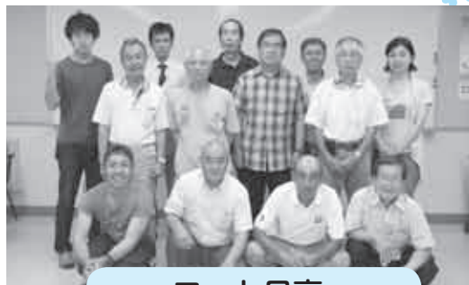
フォト日高 (日高地区センター)

●現在、どのような活動をされていますか? 平成18年から活動しています。福祉まつりや米寿記念写真の撮影といった福祉事業の写真撮影をしています。