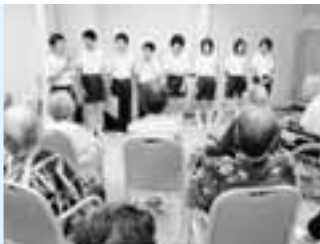
紙芝居をみんなで練習してきました。