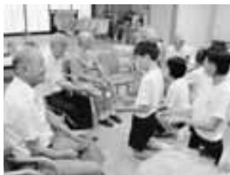
元気な中学生に負けじと、はりきる利用者さん