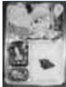
毎年恒例 コロッケ弁当