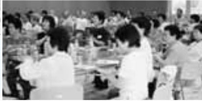
サロンで楽しめるレ クリエーションの紹 介も行われました。

サロンをより楽しく、みんなが集 える住民間交流の場となるように。 8月29日(金)日高農村環境改善 センターに、日頃サロンのお世話を されているボランティアの方87名が 集い「ふれあいいいききサロンボラ ンティア交流会」を開催しました。 事例発表、グループでの話し合い を通して各サロンの活動内容・自慢・ 悩み等を熱心に発言・情報交換さ れ大変活気のある交流会となりまし た。