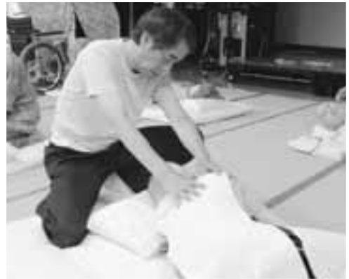
マッサージを受ける入所者からは「気持ちよすぎて寝てしまいそうだ」という声も。