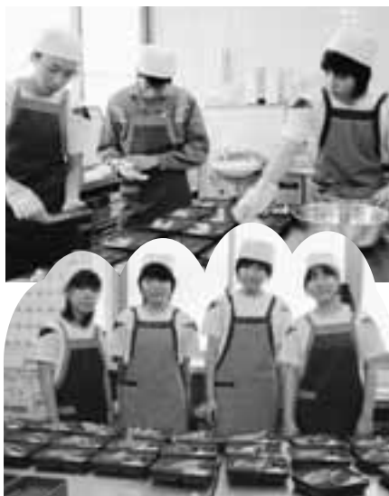
「思いやりの気持ち」をありがとう