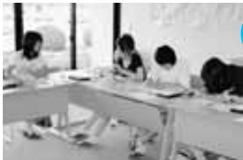
点字を間違えないように。