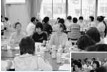
グループでの話し合いは とても参考になりました。