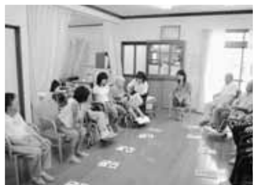
レクリエーションで楽しいひとときを過ごしました

当日はダイルーム、浴室等の掃除をおこなった後、利用者のみなさんと一緒にお茶を飲みながらお話をしたり、サイコロゲームなどのレクリエーションを行い、楽しいひとときを過ごし、高齢者との交流を深めてもらいました。