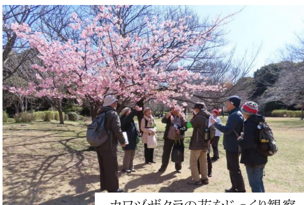
カワヅザクラの花をじっくり観察 イチヨウの幹は「あったかいね」