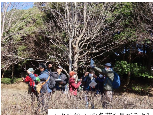
ハクモクレンの冬芽を見てみよう