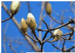
ハクモクレンの白い花の葉が出てきたカワヅザクラ

開催日：2024年3月3日(日) 晴れ 新習志野駅の前にある香澄公園は、100m×1,200mの長方形、緑がとても多く、季節ごとに様々な花々も見られ、常緑樹を中心に計画植林されている公園。