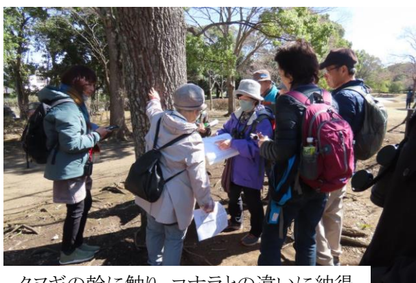
クヌギの幹に触り、コナラとの違いに納得 シンジュのタネの模型を飛ばそう