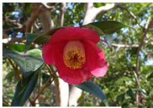
ヤブツバキの花にメジロの爪痕のシナマンサクの花が咲き始め