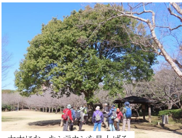
大木になったシラカシを見上げる